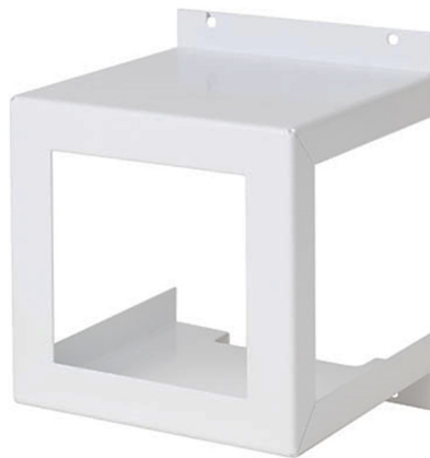
Рисунок 1 - Общий вид защитного кожуха

1.2 Общий вид защитного кожуха показан на рисунке 1.