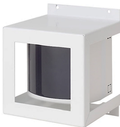
Рисунок 3 - Общий вид извещателя, защищенного кожухом

Общий вид извещателя, защищенного кожухом, показан на рисунке 3.